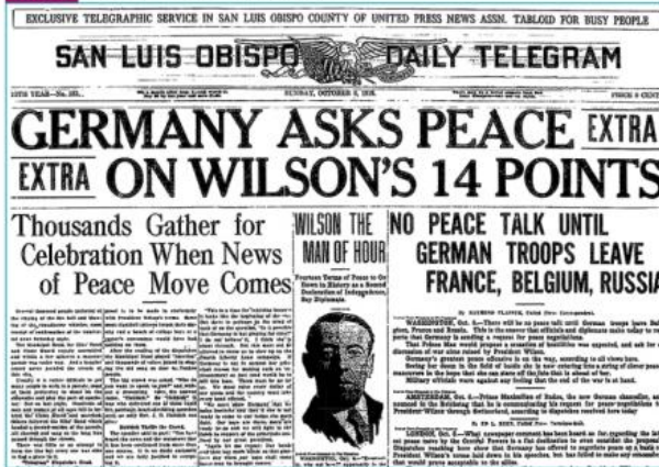
Une du journal américain Daily Telegram, 1918. « L'Allemagne demande la paix sur les 14 points de Wilson »

Cette Une illustre l'importance du rôle joué par les États-Unis dans l'arrêt des combats en 1918. Justifiez cette affirmation.