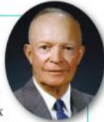
Dwight D. Eisenhower, président des États-Unis, allocution de fin de mandat, 17 janvier 1961.

Nous nous rendons pourtant compte que la première place et le prestige des États-Unis ne dépendent pas simplement de notre progrès matériel inégalé, de notre richesse et de notre force militaire, mais aussi de la façon dont nous employons notre puissance dans l'intérêt de la paix dans le monde et de l'amélioration de la condition humaine. [...] Nous avons été obligés de créer une industrie d'armement permanente de grande échelle. De plus, trois millions et demi d'hommes et de femmes sont directement impliqués dans la défense en tant qu'institution. Nous dépensons chaque année, rien que pour la sécurité militaire, une somme supérieure au revenu net de la totalité de la société américaine. [...] De même la révolution technologique des décennies récentes fut en grande partie responsable des changements radicaux de notre position militaro-industrielle. Dans cette révolution, la recherche est devenue centrale, elle est également plus formalisée, plus complexe, et coûteuse.