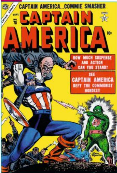
Une du magazine Captain America , n° 78, septembre 1954.