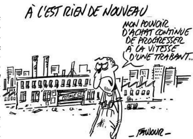
Caricature de Charlie Hebdo – 12 septembre 1990

Extraits de la déclaration d'Helmut Kohl relative à la décision prise par la chambre du peuple d'adhésion de la RDA à la RFA, Bonn, 23 août 1990.